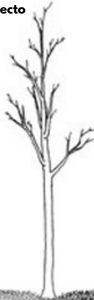
El mulch no debe estar en contacto con el tronco del árbol.